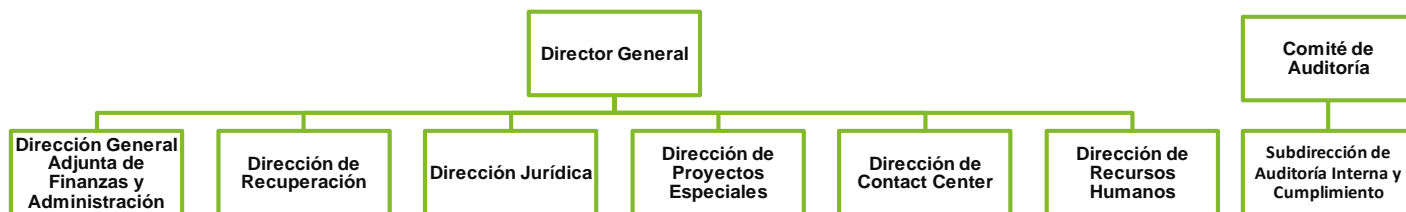
Figura 2. Estructura Organizacional